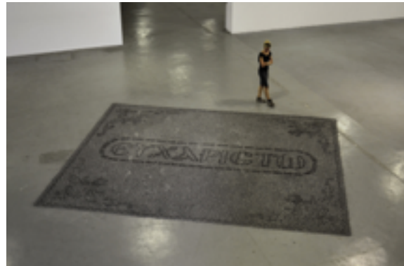
Μαρία Τσάγκαρη ευχαριστώ, 2012 Εγκατάσταση 30m², στάχτες, Αποψη εγκατάστασης του έργου για την 4η Μπιενάλε σύγχρονης τέχνης Θεσσαλονίκης, 2013 © Μαρία Τσάγκαρη

Η Μαρία Τσάγκαρη (γεννημένη το 1981) ζει και εργάζεται στην Αθήνα.