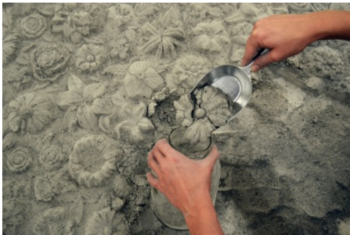
One More Garden, One More Circle , 2013 Στόχτες, 2x2m © Maria Tsagkari © Maria Tsagkari